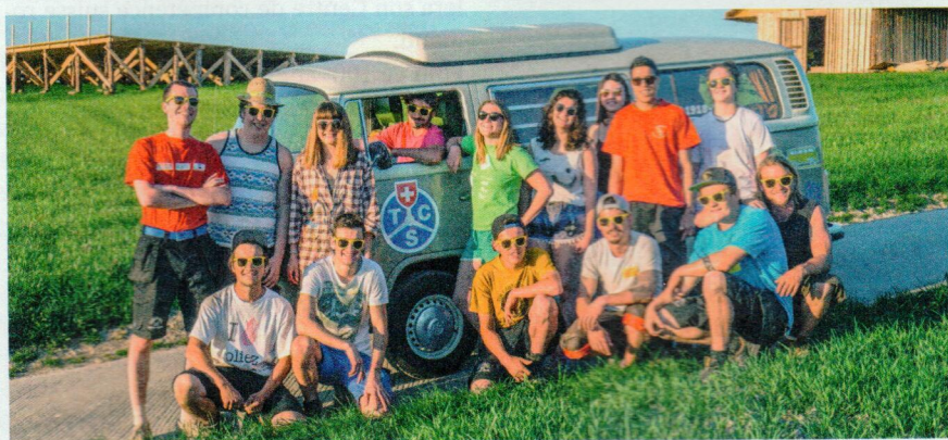
Des membres de Châpelle-Boulens ont fait la connaissance du bus VW du TCS sur la future place de fête du Giron de la Broye. Ce n'est évidemment pas ce véhicule qui servira à transporter les gironneurs.

cette action de prévention et de sécurité routières du TCS Vaud. Il s'agit du Giron de la Broye, qui se déroulera à Châpelle-Boulens du 4 au 8 juillet, et du Giron du Pied du Jura, à Grancy, du 1 er au 5 août. La collaboration entre le Giron de la Broye et le TCS Vaud est une première. Les horaires des bus sont d'ores et déjà en ligne sur le site de la Section vaudoise du TCS et des girons concernés. Une équipe du TCS sera toutefois présente sur la place de fête lors de la manifestation avec un stand d'informations.